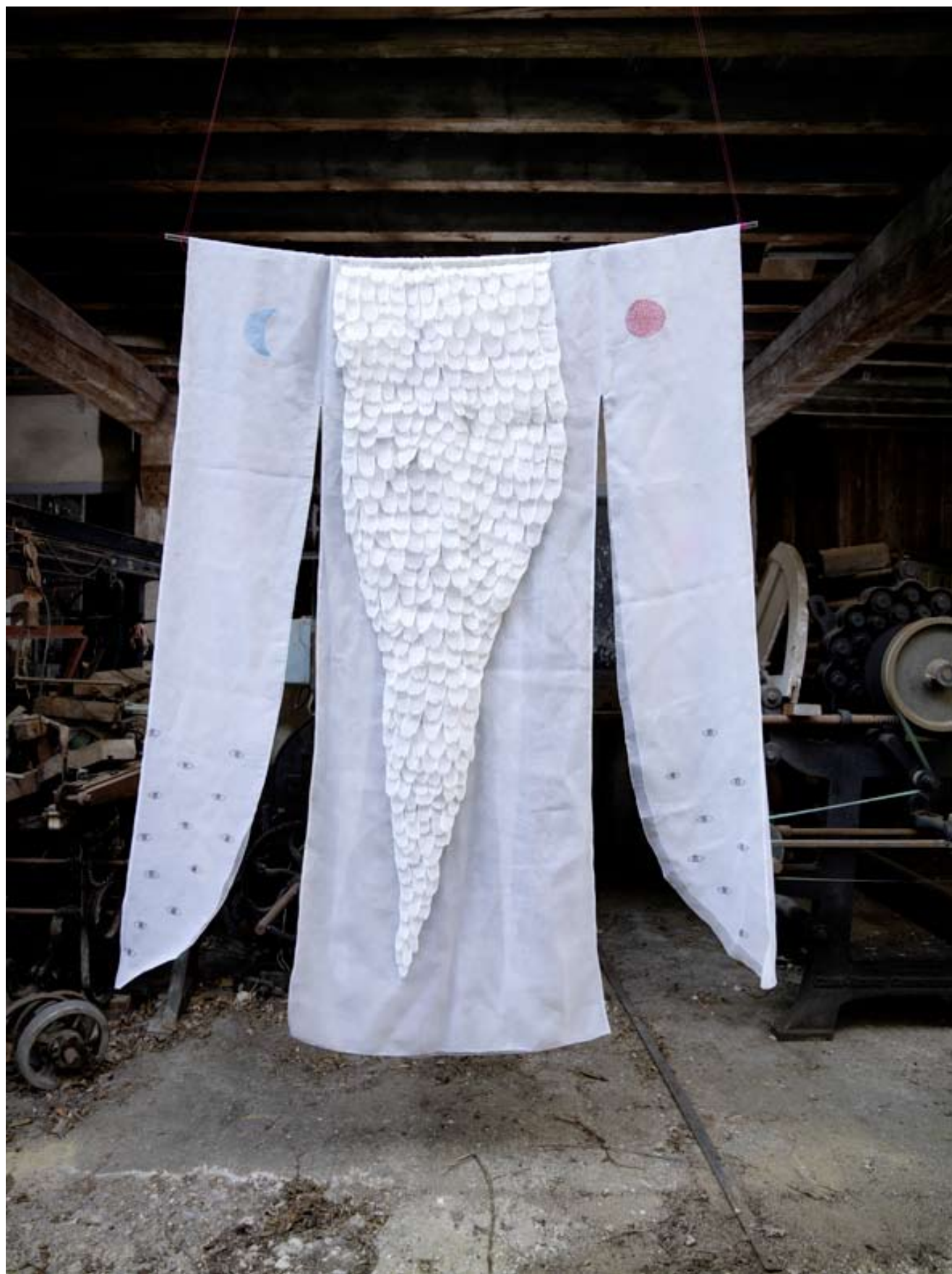
Xue Fen Cheng