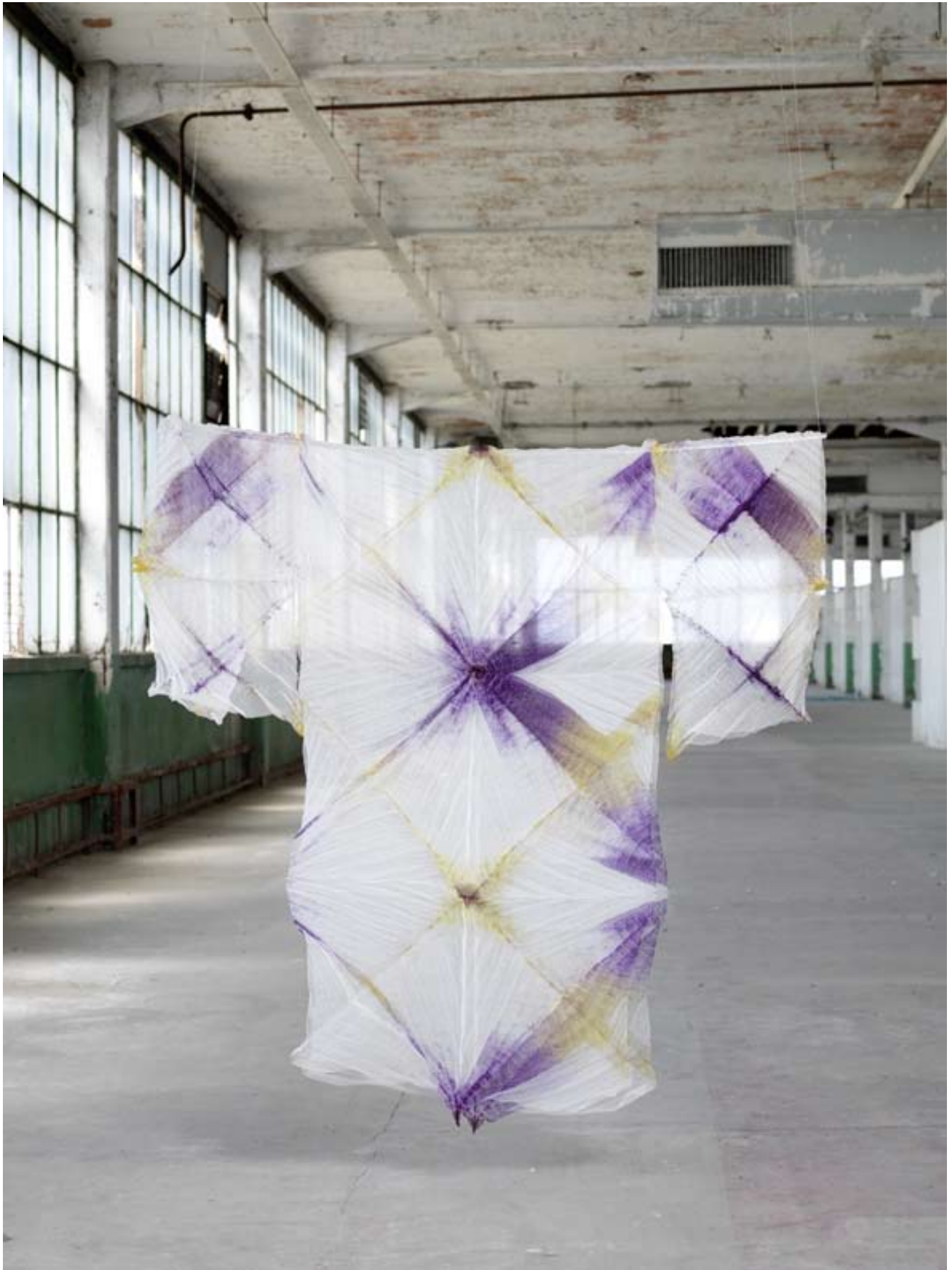
Ysabel de Maisonneuve